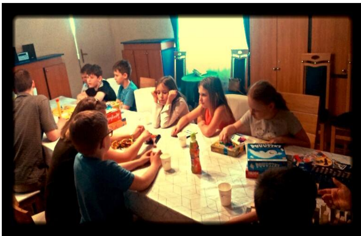
Na zdjęciu dzieci podczas zajęć